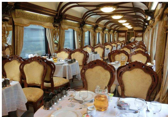
Vagone ristorante russo (esempio)