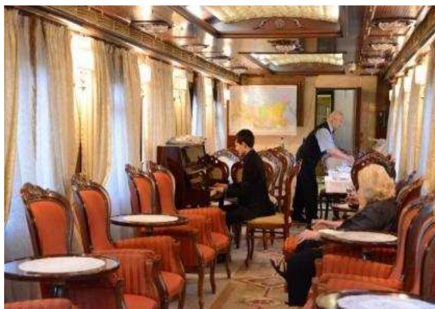
Vagone Bar-Lounge (esempio)

Questo è il luogo più attraente del treno ed è aperto sempre fino a tardi. Venite, accomodatevi e gustatevi i meravigliosi paesaggi, oppure in serata assaggiate qualche bevanda locale ascoltando della buona musica dal vivo.