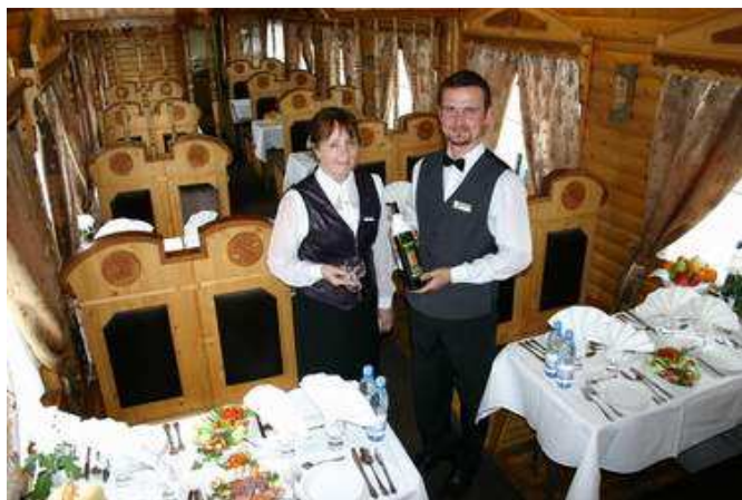
Vagone ristorante russo (esempio)