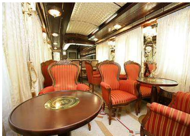
Vagone Bar-Lounge (esempio)